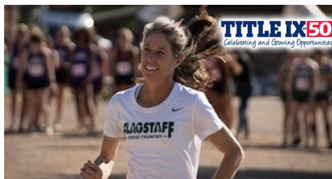
Title IX: Flagstaff's Painter follows in footsteps of original trailblazers